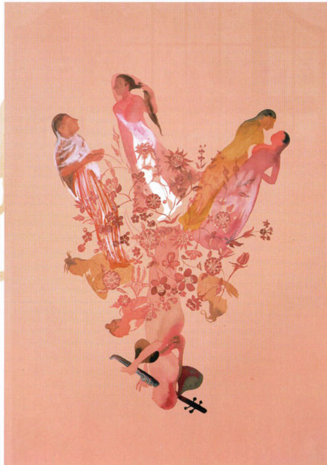
Shahzia Sikander, To Emerge/Surgir . Ink and gouache on paper/tinta y gouache sobre papel, 2004.

las iconografías recibidas. Sikander compara su estilo de trabajo con las técnicas de muestreo de un disc jockey, pequeños trozos de música se reciclan formando canciones completamente diferentes por medio de cortes, manipulación y distorsión.