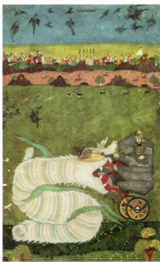
Isfandiyar Attacks the Dragon (Shahnama) Isfandiyar ataca al dragón. Opaque watercolor and gold on paper/ acuarela opaca y oro sobre papel, Deccani school, ca. 1760/ Escuela decaní, alrededor de 1760. Edwin Binney 3rd Collection 1990:543.

The artist inserts imagery into her work that expresses the historical turmoil of the region, the split between Muslim and Hindu societies, and the hostile and violent clashes brought about by these differences. Her work often features women in diverse roles and situations that allude to the overlapping histories of her sources and her own life experiences. When Sikander came to the United States she encountered feminist intellectual thought such as the theory of écriture féminine (the female body in writing) put forward by the French writer Hélène Cixous. She also met women artists who were experimenting with the painting process from a position of a feminine subjectivity. All this new information became Sikander's vehicles for developing an even more poignant relationship with the sensual and sexual aspects of the Hindu miniatures.