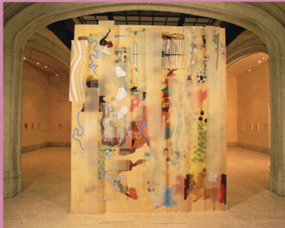
Shahzia Sikander, To Reveal or Not to Reveal/Revelar o no revelar . Acrylic, gouache, and ink on tissue paper/acrílico gouache y tinta sobre papel de seda, 2004.

Sikander received the South Asian Women's Creative Center for Contemporary Art Award in 1999, the Joan Mitchell Award in 1999, and the Louis Comfort Tiffany Foundation Award in 1997. She is one of the artists featured on the Public Broadcasting Service's television series and publication, art: 21 . She currently lives in New York City.